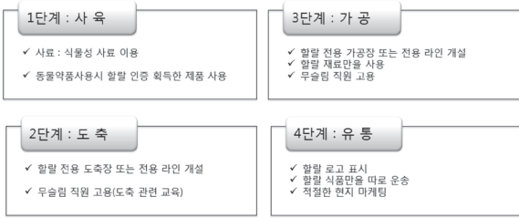
Fig. 2. Halal certification in livestock (Ahn and Kang, 2014)