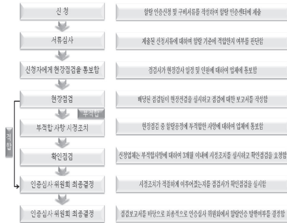
Fig. 3. Flow chart of Halal certification

세 번째, 할랄 전용 라인의 개설의 필요성으로 절단공정 이외의 다른 공정이 같다고 하여도 할