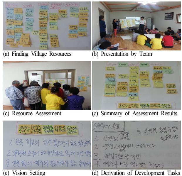
Figure 3. Vision-setting Process of Bonghwang Village

기본구상단계에서 자원찾기를 통해 공유한 자원을 활용하여 마을의 비전 및 목표를 설정하였다. 주민들은 자신들의 지역에서 이루어지길 바라는 생활상과 자신들의