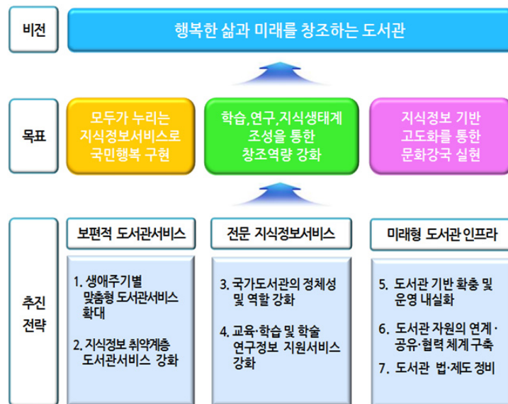
<그림 1> 제2차 도서관발전종합계획(2014~2018)의 비전 및 추진방향 (도서관정보정책위원회 2014)

제2차 종합계획에서는 '행복한 삶과 미래를 창조하는 도서관'이라는 비전을 설정하고, 비전 달성을 위해 3대 정책목표, 7대 추진 전략과 20개 정책 과제 등을 제시하고 있다. 계획의 3대 정책 목표로는 '모두가 누리는 지식정보서비스로 국민행복 구현', '학습, 연구, 지식생태계 조성을 통한 창조역량 강화', '지식정보 기반 고도화를 통한 문화강국 실현'을 제시하고 있고, 이러한 정책목표를 달성하기 위하여 '생애주기별 맞춤형 도서관서비스 확대', '지식정보 취약계층 도서관서비스 강화' 등 7대 추진전략을 제시하고 있다 (도서관정보정책위원회 2014). 제2차 도서관발전종합계획(2014~2018)의 비전 및 3대 목표, 추진방향 등은 <그림 1>과 같다.