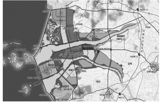
그림 2. 2008년 토지이용계획