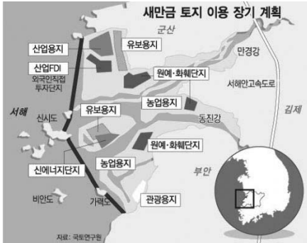
그림 1. 2007년 토지이용계획