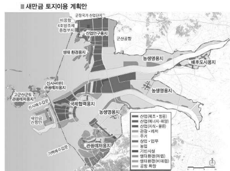
그림 4. 2014년 토지이용계획

농업용지 이외 생태환경용지와 농촌도시용지가 2개 분포하고 있음을 알 수 있다. 신재생에너지용지 일부는 바이오 에너지 작물을 재배하는 재배지로 농림축산식품부에서 관할한다.