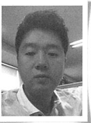
이 동 일 축산신문 기자

우리 육우는 어디쯤에 있는 것인지. 솔직히 감이 오지 않는다. 개인적으로 좀 더 솔직하게 말하자면 아직 산업으로서 논의할 수 있는 수준이 아니지 않을까라는 반문도 해본다.