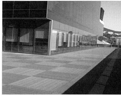
▲ 흡연실 및 임시피난지역으로 활용되는 5층 테라스