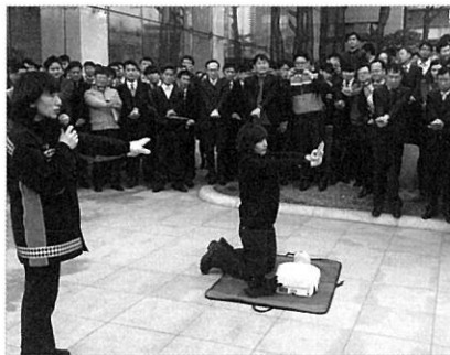
▲ 한진중공업 전 직원 화재예방교육