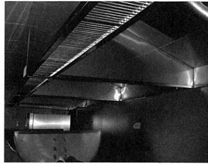
▲ 안전하고 청결하게 관리되고 있는 주방후드

창조의 시대, 상상력의 시대라 불리는 요즘, 새로운 가치를 먼저 찾아내어 새로운 시장을 창출하는 기업만이 지속적인 성장이 가능할 것이다. 창조경영을 경영이념으로 보다 앞선 미래를 위한 창조혁명을 강조하고 있는 한진중공업이 세계시민으로부터 사랑받는 글로벌 기업으로 앞으로도 지속적인 성장을 이루길 바라며 탐방을 마쳤다. ☺