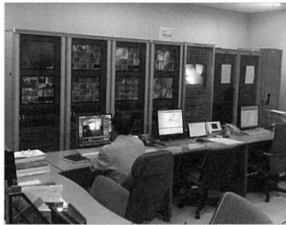
▲ 방재실 내부