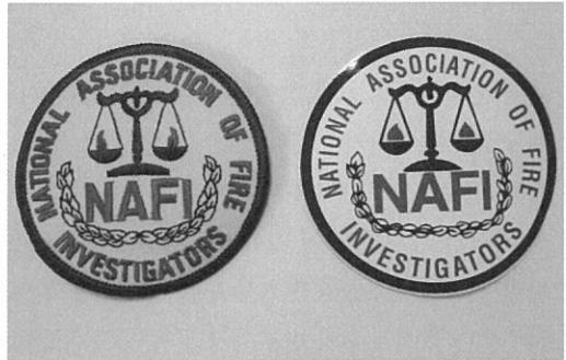
NAFI Patch 및 NAFI Emblem