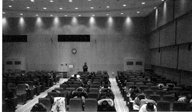
[사진 1] 2012년 CFEI 자격시험 응시장면

약 6주 정도가 경과되면 시험결과가 메일로 통보되는데 시험에 합격하지 못한 응시자는 시험 종료 후 최소 6개월이 경과해야만 CFEI 시험에 재응시 할 수 있다.