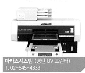
마카스시스템 (평판 UV 프린터) T. 02-545-4333