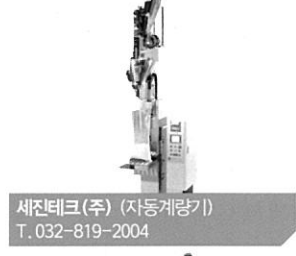
세진테크(주) (자동계량기) T. 032-819-2004