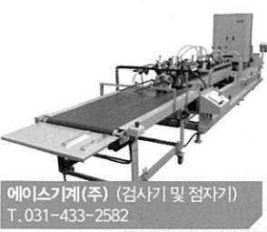
에이스기계(주) (검사기 및 점자기) T. 031-433-2582