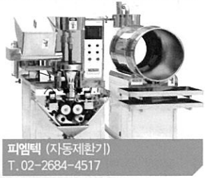
피엠텍 (자동제환기) T. 02-2684-4517