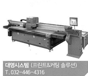
대영시스템 (프린트&커링 솔루션) T. 032-446-4316