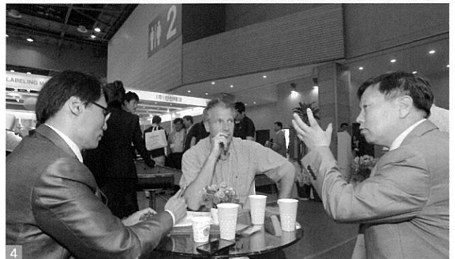
1. KOREA PACK 2012 개막식 장면 2. KOREA PACK 2012 내빈 전시장 투어 3. KOREA PACK 2012 행사장 입구 4. 글로벌바이어 미팅 장면

약, 화장품, 화학산업의 구매결정권자를 대거 초청하는 다양한 부대행사를 준비하며, 홍보에 박차를 가하고 있다. 이를 통해 참가업체와 구매결정권자 간의 정보교류 및 제품홍보 효과를 크게 높여 전시 참가기업을 지원한다는 방침이다.