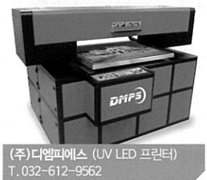
(주)디엠피에스 (UV LED 프린터) T. 032-612-9562