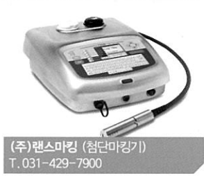
(주)웬스마킹 (첨단마킹기) T. 031-429-7900