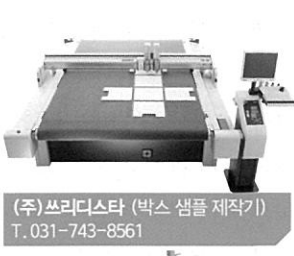
(주)쓰리디스타 (박스 샘플 제작기) T. 031-743-8561