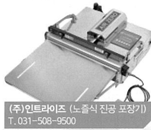
(주)인트라이즈 (노즐식 진공 포장기) T. 031-508-9500