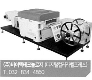
(주)바이텍테크놀로지 (디지털라벨프레스) T. 032-834-4860