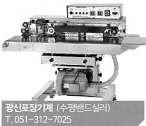
광신포장기계 (수평밴드슬러) T. 051-312-7025