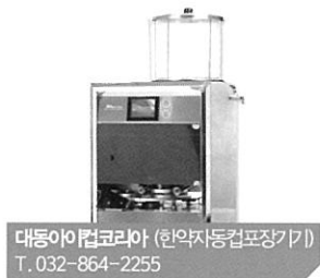
대동아이팩코리아 (한약자동포장기) T. 032-864-2255