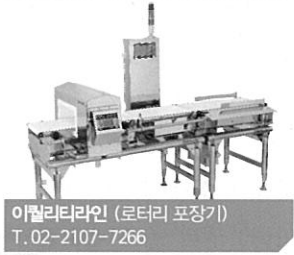
이필리타라인 (로터리 포장기) T. 02-2107-7266