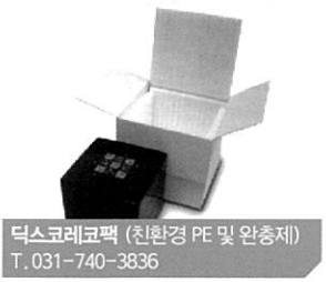
덱스코레코팩 (친환경 PE 및 안종제) T. 031-740-3836