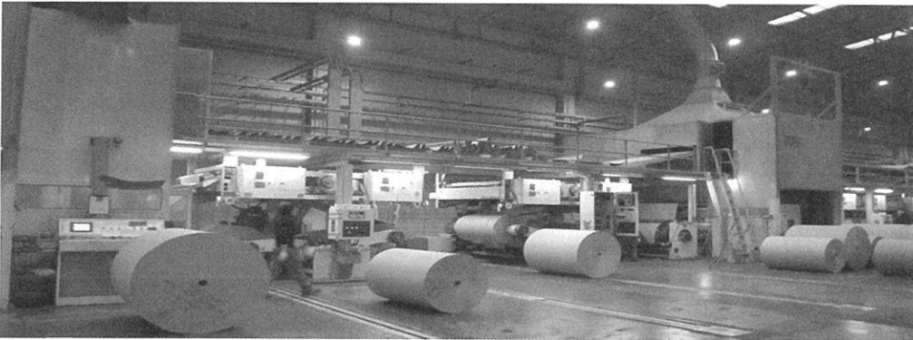
<표1> 골판지포장생산 현황

올해 초 골판지포장기업을 대상으로 실시한 골판지 생산현황 결과, 2012년도 총 생산량은 49억9500만㎡으로 전년대비 약1.83% 증가하여 50억㎡ 돌파를 눈앞에 두고 있다. 이를 금액으로 환산하면 약 3조2천5백억원에 달한다. 이는 택배산업의 연 7~8%대의 꾸준한 성장(한국통합물류협회), 핵가족화에 따른 포장단위 소형화 및 농산물의 골판지포장화 증가에 따른 골판지상자 수요 증가로 분석된다.