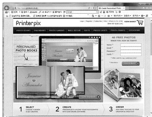
Syncoms그룹 홍보물과 개인맞춤화된 사진제품을 서비스하는 Printer Pix 홈페이지