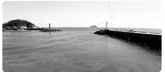
▲ 안흥항 등대

⑩ 썰물로 인해 나타나는 모랫등 현상을 촬영한 사진. 풀등이라고도 하는 모랫등은 물이 빠지면서 지형이 높은 부분이 나타나게 되는데, 대표적으로 전라남도 진도, 충남 보령 무창포의 '신비의 바닷길'과 같은 현상이다. 조수간만의 차가 큰 우리나라 서남해안에서는 흔히 일어나는 현상이다. 신진대교 아래 모랫등은 그냥 지나치기 쉽다. 차로 달리다 보면 다리 아래 현상을 볼 겨를이 없기 때문이다. 썰물 때, 다리 위 인도에서 느긋하게 기다리는 것이 좋다. 간조가 되는 시간을 정확히 알아내 30~40분 전에 현장에 가서 촬영준비를 한다. 풍경 사진은 맑은 날씨를 택하는 것이 촬영의 기본이다. 특히 신진대교 모랫등은 멀리 파도리 원경이 아스라이 보여야 하고 바다 물빛도 고와야 하기 때문이다. 물이 빠지면서 모랫등의 넓이와 위치가 조금씩 달라진다. 달라진 위치에 따라 새롭게 구도를 잡아 보는 것도 재미있다. 썰물 때 촬영하는 방법도 있지만, 간조 때를 기다려 물이 드는 밀물 때 촬영할 수도 있다. 해의 위치를 보고 알맞은 방법을 선택할 일이다. 조리개는 조여 피사계 심도를 깊게 한다. 삼각대는 굳이 준비하지 않아도 된다.