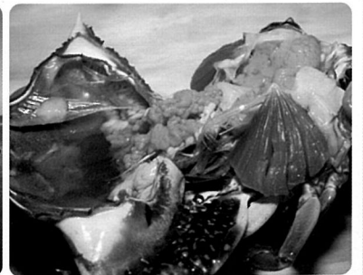
▲ 꽃게 요리