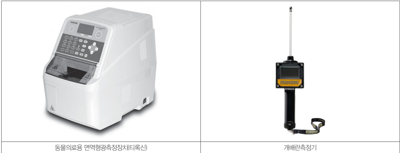
〈그림 1〉 국내에서 최초로 등록된 반려동물용 의료기기 외관 사진 및 명칭