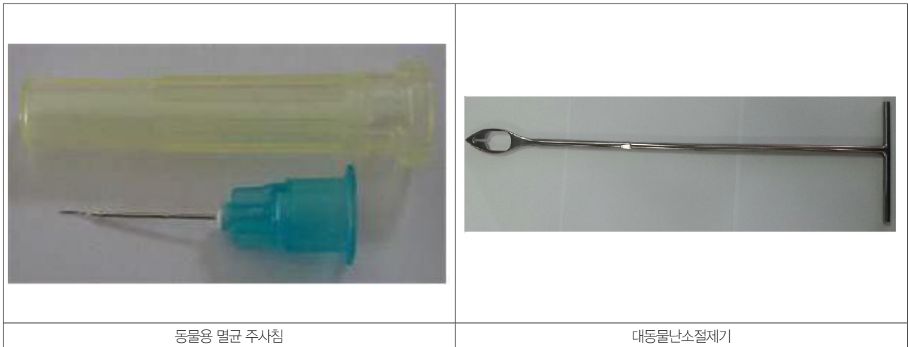
〈그림 2〉 국내에서 최초로 등록된 산업동물용 의료기기 외관 사진 및 명칭

2013년 3/4분기에도 새로 동물용 의료기기로 등록된 품목이 예전보다도 훨씬 많아졌다. 이러한 이유는 최근에 동물 의료분야에 대한 시장 확대와 의료 수준에 대한 서비스 수준이 향상됨으로 인하여 국내외 의료기 업체에서 공급에 보다 많은 관심을 갖고 있기 때문이다. 이번에 등록된 품목을 포함하여 현재까지 등록된 동물용 의료기기에 대한 정보는 농림축산검역본부의 동물용의약품관리시스템( https://medi.qia.go.kr )통합검색)에서 확인할 수 있다.📄