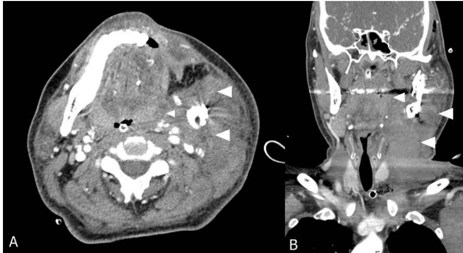
Fig. 2. A: sagittal view; B: coronal view of computed tomographic scan of the neck is demonstrating hematoma which compressing upper airway (white arrow).

dobutamine 30 \mu g/kg/minute, norepinephrine 0.2 \mu g/kg/minute로 주입하기 시작하였고 혈압은 120/70 mmHg, 심박수는 140회/분을 유지하였다. 이후 midazolam과 rocuronium 지속주입으로 진정시키고 인공호흡기로 인공호흡을 시행하였다. 이후 혈압이 오르면서 norepinephrine, dobutamine, dopamine의 순서로 주입량을 줄이면서 투여를 중지하였다. 이후 시행한 컴퓨터 단층 촬영에서 구강부위에서 성문 상방 부위까지 상기도를 압박하는 혈종과 부종이 관찰되었다(Fig. 2). 혈액검사서서 Hb 7.3, K + 2.1 mmol, CK 538, CK-MB: 2.49로 나타나 농축적혈구 2 단위를 수혈하고 KCL 20 mEq를 생리식염수에 500 ml에 혼합해서 점적 하여 주입하였다. 다른 검사결과에서는 특이사항이 없었다. 수술 후 3일째 midazolam의 주입을 중지하자 환자가 지속적으로 경련을 하기 시작하였으며 의식수준은 반 혼수(semi-coma) 상태였다. 신경과 협진과 함께 시행한 자기공명영상 촬영에서 광범위한 뇌부종을 동반한 대뇌피질과 기저핵의 전체적인 저산소성 손상이 나타났다. Phenytoin 투여 후 경련은 멈추었으나 의식상태는 회복되지 않았다. 술 후 5일째 신경과로 전과되었으며 지속적으로 보존적 치료를 받던 중의식을 회복하지 못한 상태로 술 후 93일째 타 병원으로 전원되었다.