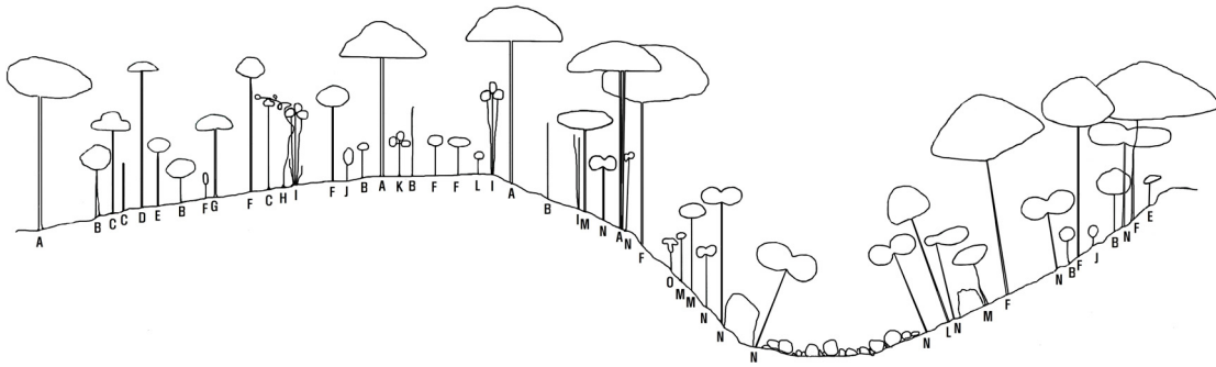
Fig. 4. A cross sectional view of V. bracteatum habitat in Shinrea Valley. A : Quercus acuta Thunb., B : Eurya japonica Thunb., C : Platycarya strobilacea Siebold & Zucc., D : Albizia julibrissin Durazz., E : Symplocos sawafutagi Nagam., F : Castanopsis cuspidata var. sieboldii (Makino) Nakai, G : Meliosma oldhamii Miq., H : Smilax china L., I : Vaccinium bracteatum Thunb., J : Camellia japonica L., K : Vaccinium oldhamii Miq., L : Ilex rotunda Thunb., M : Cleyera japonica Thunb., N : Distylium racemosum Siebold & Zucc., O : Dendropanax trifidus (Thunb.) Makino.

라산 식생의 수직분포상 상록활엽수림지대이고, 기후변화에 따른 상록활엽수림이 확대에 따라 사스레피나무, 구실잣밤나무 등의 숲이 지속적으로 발달되어 울폐될 경우 본 조사지에서 조사된 모새나무는 쇠퇴할 것으로 판단되었다.