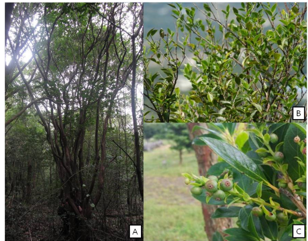
Fig. 2. Habitat and shape of V. bracteatum in Shinre Valley. A : Habitat, B : young trunk and leaves, C : fruits.