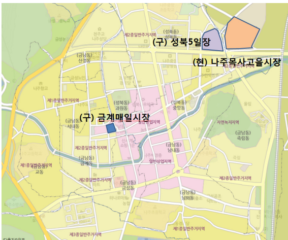
Figure 1 나주목사고을시장의 위치.

본 연구의 공간적 범위로는 전라남도 나주시 청동길 14번지에 위치하고 있는 나주목사고을시장을 사례지역으로 선정하여 연구를 진행하였다. 내용적 범위로는 나주목사고을시장의 상인과 고객을 대상으로 설문조사를 실시하여 통합·이설에 의한 시설현대화사업의 만족도와 성과를 분석하고 문제점을 진단하고 전통시장 활성화를 위한 대안중 하나로서 문화관광형 시장육성프로그램에 대한 상인과 고객의 견해를 조사·분석하고자 한다.