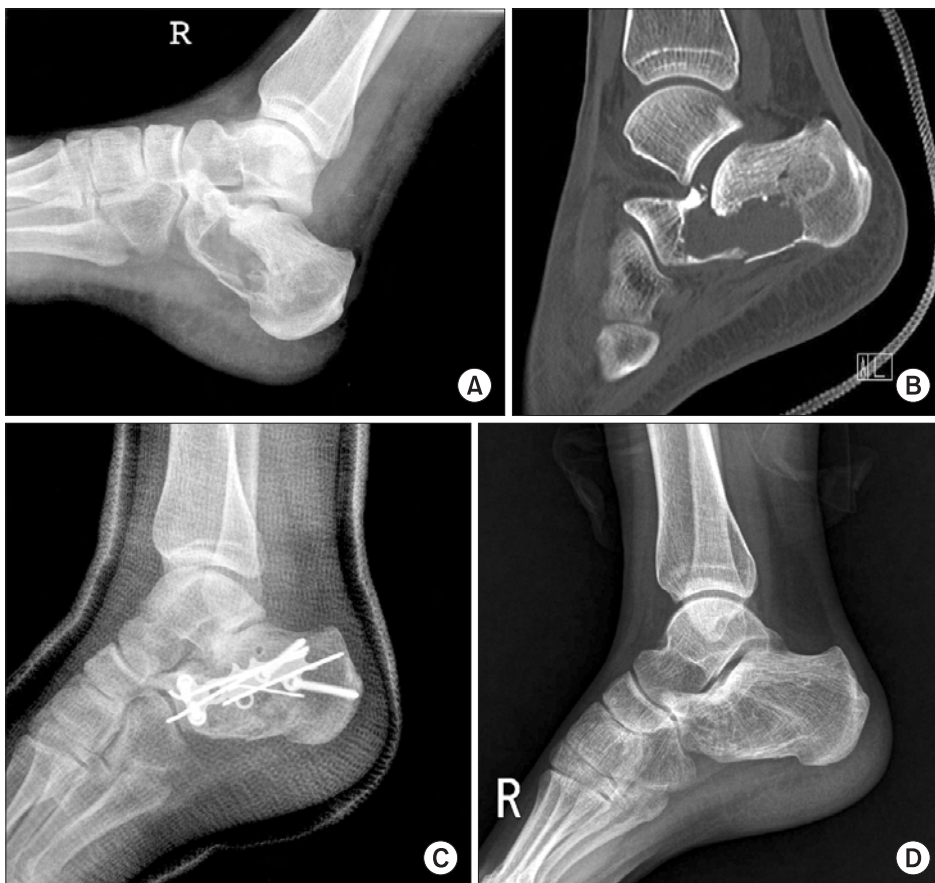
Figure 3. (A) Cystic lesion with pathologic fracture was found in radiograph after fall-down. (B) CT scan showed comminuted fracture extending to large low density lesion. (C) Postoperative radiograph showed state of open reduction and internal fixation with allo chip bone graft. (D) Radiograph of 3 year follow-up showed consolidation of grafted bone.

연골모세세포종은 비교적 드문 양성 골종양이나, 국소 재발률이 10-35% 정도로 보고되어 수술 시 충분한 제거가 필요한 것으로 알려져 있다. 20-22) 본 연구에서 거골의 연골모세세포종은 3예였고, 모두에서 소파술 및 동종골 이식술을 시행하였다. 그 중 1예에서 수술 후 단순 방사선 검사 추시 상 국소적으로 음영이 감소하여 재발이 의심되었으나, 증상이 없으며 상태 유지되어 경과관찰 중이다. 종골의 연골모세세포종 환자 1예는 22세 남자로 통증으로 본원 외래 방문하여 단순골낭종 의심 하에 경과관찰 하던 중, 염좌 후 병적 골절 발생하여 입원하였다. 골절은 전위가 심하지 않으며, 거골하 관절이 양호하여 석고붕대하여 경과관찰 하였으며, 골유합 이후 생검술 시행하여 연골모세세포종으로 진단 후 소파술 및