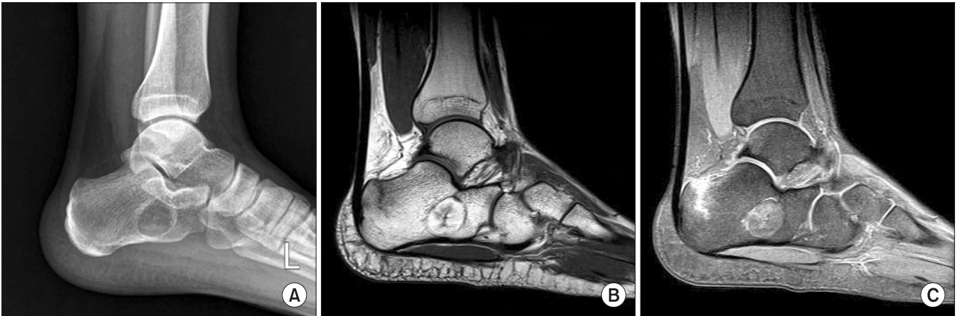
Figure 4. (A) Radiolucent cystic lesion with well-defined margin in calcaneus found in radiograph after playing soccer. (B) T1-weighted MRI showed well-defined fat signal mass and vertical fracture line on posterosuperior aspect of calcaneus. (C) T2-weighted MRI showed well-defined mass and vertical fracture on calcaneus with perilesional bone contusion.