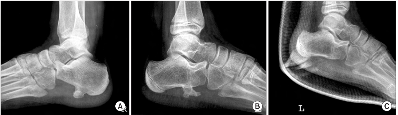
Figure 5. (A) An exophytic osseous mass at plantar surface of calcaneus was found in radiograph. (B) A large exophytic osseous mass at plantar surface of calcaneus was found in plain-film radiograph. (C) Postoperative radiograph showed excised osteochondroma.