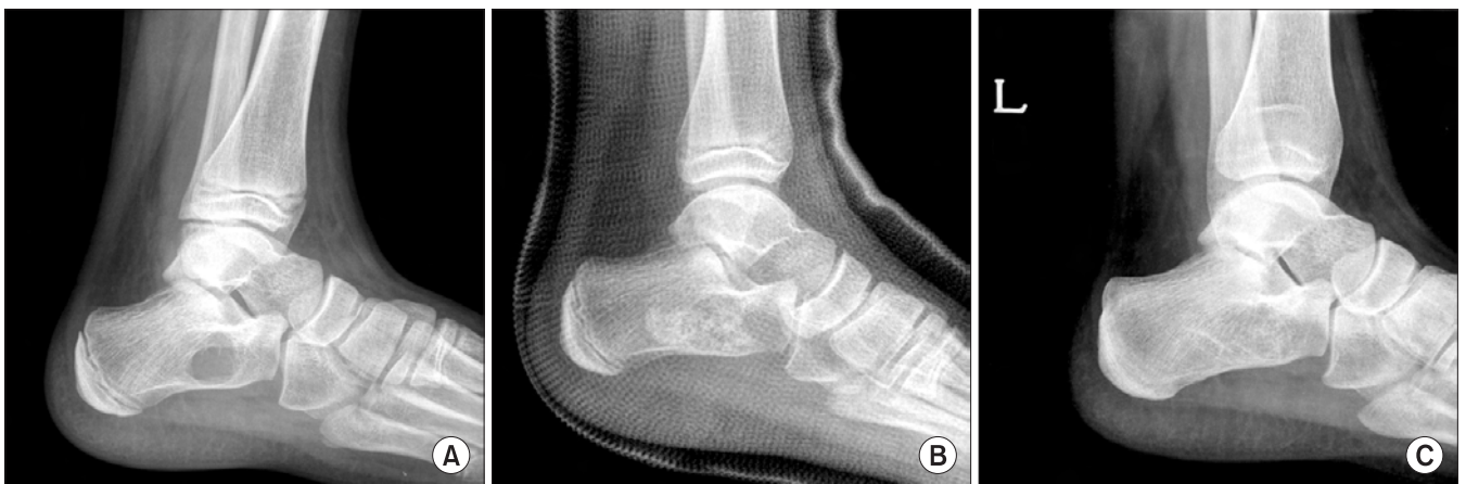
Figure 1. (A) Cystic lesion with well-defined margin in calcaneus was found accidentally after ankle sprain. (B) Cyst was diagnosed as simple bone cyst, filled with allograft chip bone graft. (C) Radiograph of 5 year follow-up showed consolidation of grafted bone post-operatively.