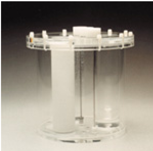
Fig. 2. NEMA-1994 Phantom (National Electrical Manufacturers Association) was used. The fillable inserts are clear lucites.

에 미치는 감쇠 오차 및 영향의 정도를 방사능 값과 백분율 오차로 알아보았다.