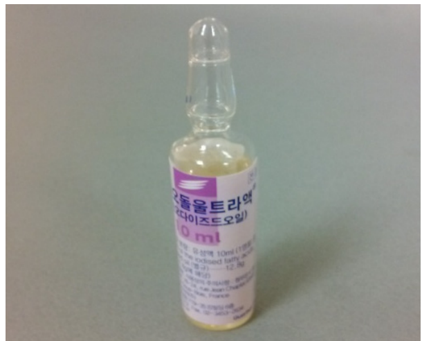
Fig. 3. Lipiodol Ultra-Fluid (Iodised Oil) was filled in the NEMA-1994 Phantom's insert.