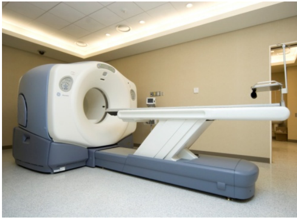
Fig. 1. PET/CT GE Discovery-STE16 (GE Healthcare, Milwaukee, USA) was used for this study.

한편 HCC환자의 경우는 18 F-FDG PET이 제한적으로 진단의 용도로 사용되며 50% 에서 55% 정도의 낮은 민감도를 가진다. 이러한 낮은 민감도는 간세포에서 포도당 인산 가수 분해 효소가 다른 장기에 비해 높은 비율을 보이는 것과 같이 생리학적인 요소를 가지는 것에 한가지 원인이 있다. 또 다른 원인으로 TACE시술후 검사를 하는 경우에는 Lipiodol 물질이 감쇠 보정 오차로 인해서 잔존 가능한 종양 결정에 어려움을 주는 것으로 인하여 부정확한 결과를 초래하는데 영향을 준다고 알려져 있다. 2) 이에 본 연구는 Lipiodol을 주입한 TACE 시술 후 PET/CT검사 시 영상