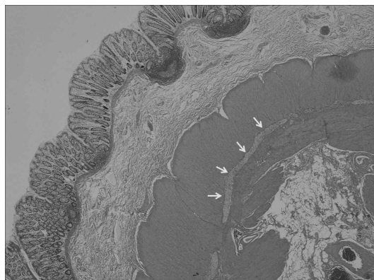
Fig. 3. Microscopic examination shows marked hypertrophy of the inner circular muscle layer and abnormal location of ganglion cells (oblique arrows) within the inner circular muscle layer (H & E, x 20).