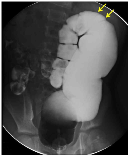
Fig. 1. Barium enema shows dilated rectosigmoid colon with abrupt transition to a normal proximal colon.

은 양의 변이 차 있었다. 본원에서 시행한 복부 단순촬영 상 장 폐색의 소견은 없었으며, 대장 내에 많은 양의 변이 관찰되었다. 대장조영술에서 직장구불결장이 심하게 확장되어있었고, 그 상방으로 갑작스런 이행부위가 관찰되며 상방의 근위부 대장은 정상이었다(그림 1). 본원에서 시행한 직장 생검