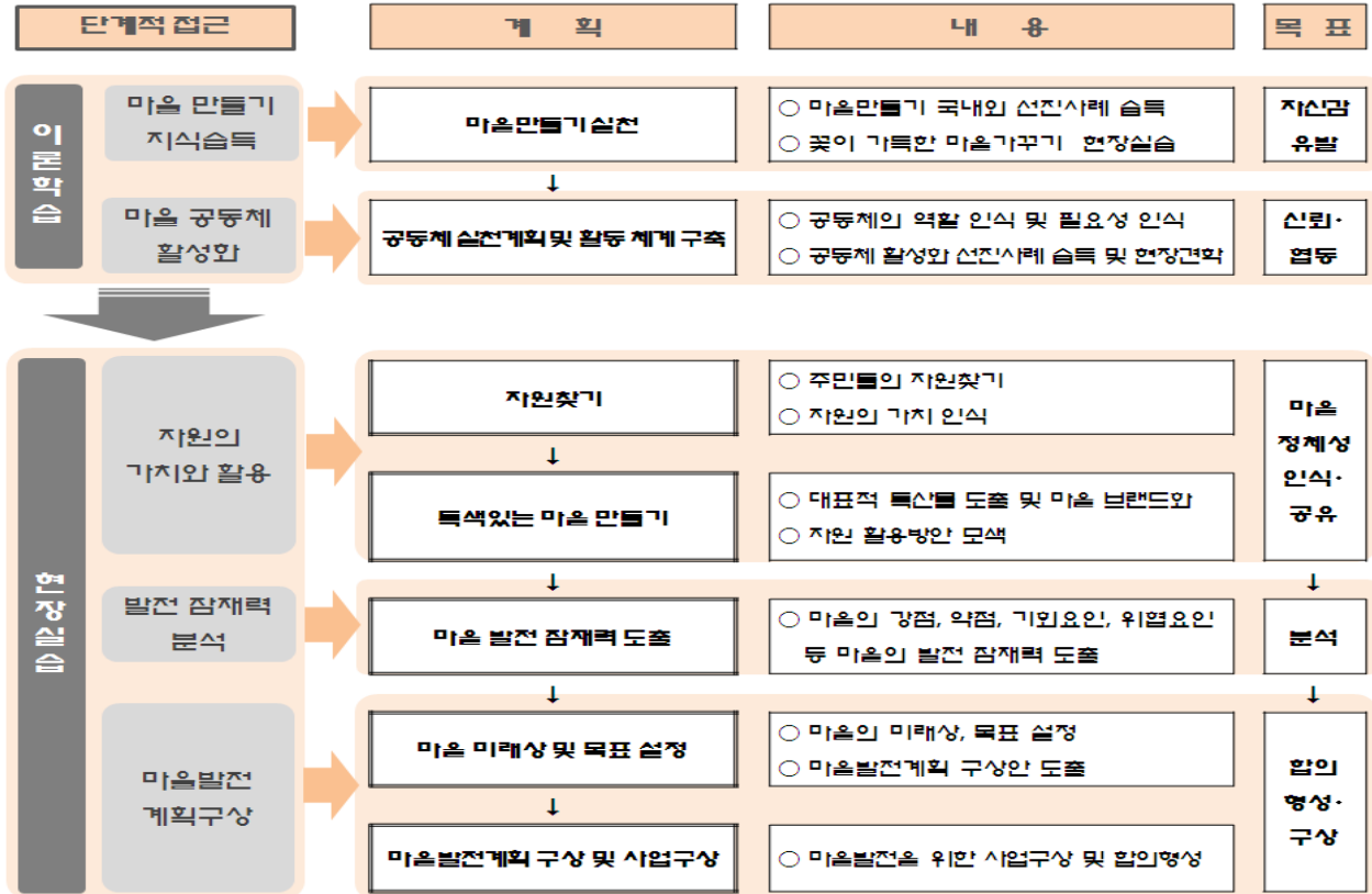
Figure 2 교육 프로그램 내용 및 목표.