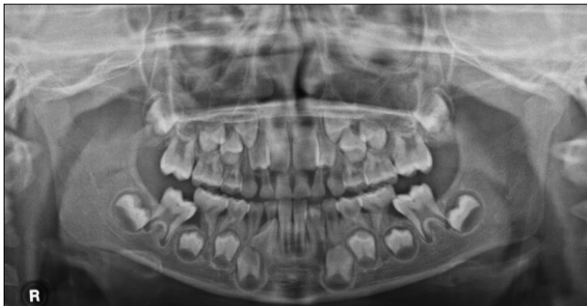
Fig. 1. Pre-treatment panoramic view. The mandibular first molars are erupting ectopically and entrapped by the primary second molars. The distal roots of each primary second molar are severely resorbed and note the caries on mandibular first molars.

8세 4개월 남아로 정기적인 구강검진 중에 양측 상악 제1대구치의 이소맹출이 관찰되어 방사선검사를 시행하였다. 방사선 사진 검사 결과 양측 상악 제1대구치의 근심경사와 제2유구치 원심치근의 흡수가 관찰되었다(Fig. 5). 이 환아 역시 이소맹출에 의한 특별한 불편감을 느끼지 못하였다. 첫 번째 증례와 마찬가지로 modified bilateral Halterman appliance를 제작, 장착한 후 교정력을 가하였다. 장치 장착 14주 만에 이소맹출이 완전히 해소되어 장치를 제거하였으며(Fig. 6), 2년 후 정기검진 시 제2유구치의 동요도 및 임상적 증상은 없었으며 제1대구치의 정상적 맹출이 이루어진 것을 관찰할 수 있었다.