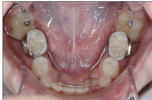
Fig. 2. Modified bilateral Halterman appliance is cemented to move mandibular first molars distally. Occlusal buttons are bonded with composite resin and chain elastics are applied.