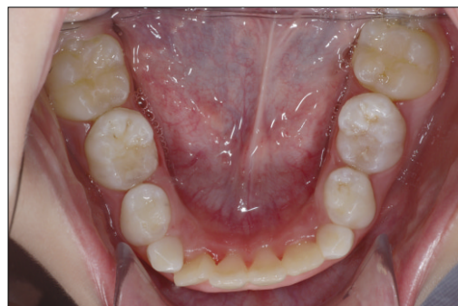
Fig. 4. Three months after removal of the appliance. The spaces of overcorrection between primary second molar and first molar are diminished and mandibular first molars are erupted into normal position.