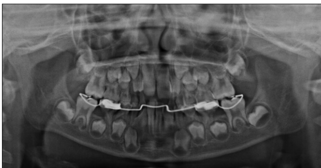
Fig. 3. Three months after delivery of the appliance. Both mandibular first molars are disimpacted. To avoid possible relapse, overcorrection was done prior to removal of appliance, leaving 2 mm of space between the first permanent molar and primary second molar each side.