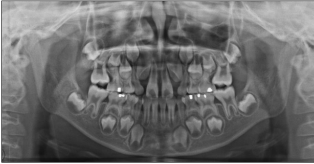
Fig. 5. Pre-treatment panoramic view. The maxillary first molars are erupting ectopically, resorbing the root of primary second molars.