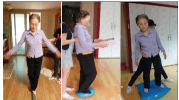
그림 3. 현실화된 과제 지향 프로그램

본 연구에서는 현실화된 과제 지향 프로그램을 위해 작업치료실에서 흔히 접할 수 있는 밸런스 빔, 밸런스 쿠션, 밸런스 보드를 이용하여, 최대한 가상현실 프로그램과 같은 효과를 얻을 수 있도록 현실화된 과제 지향 프로그램을 구성하였다(그림 3). 매 회 프로그램의 순서는 반복 학습에 의한 효과를 방지하기 위하여 무작위로 시행하였으며, 대상자의 프로그램에 대한 적응 정도에 따라 난이도를 조절하였다.