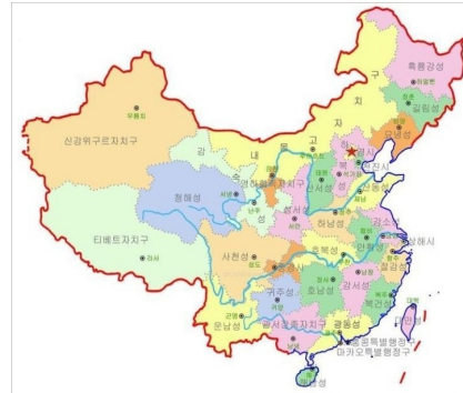
Figure 1 내몽고 자치구의 위치.

의사를 고찰하고 이를 바탕으로 잠재된 관광농업 수요를 개발하여 내몽고 자치구의 관광농업 활성화방안을 제시하고자 한다.