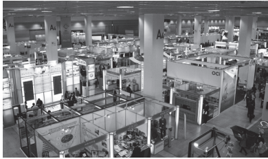
제6회 한국 건축산업대전 개막 장면과 대전 전경

며, 친환경건축과 관련된 건축사무소/건설자재/조경/에너지/환경기업이 참가하여 정보를 교류하는 건축전문전시회이다.