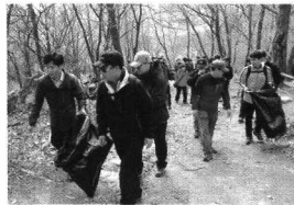
수리산 둘레길 자연정화 활동