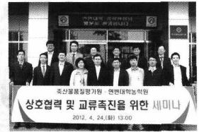
모든 일정을 마치고