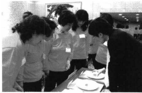
회원들 대상으로 홍보 중

전국주부교실중앙회 지도자대회에서 홍보 및 교육 축산물품질평가원은 지난 4월 17~18일 전국주부교실중앙회 지도자대회에서 기관소개 및 주요사업에 대하여 1,200여명