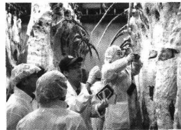
현장견학 : 도드람LPC

질평가원을 방문하였다. 이들은 보다 생생한 현장체험을 위해 오전에는 도드람 LPC를 방문하여 소도체 등급판정과정 및 결과 환류, 경매과정을, 안성CM에서는 발골·정형 및 패킹과정, 부위별 포장 과정 등을 살펴보았다. 오후에는 품질평가원에서 '한국의 한우 품질고급화 사례와 연변 황우의 발전방향'이라는 주제로 세미나를 가진 후 홍보관 및 유전자분석실도 함께 둘러보았다.