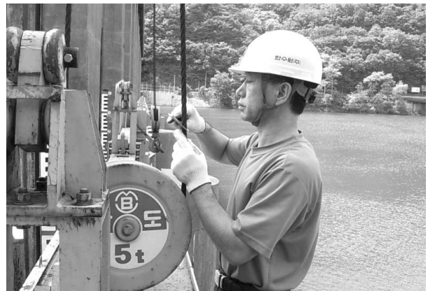
[그림 1] 홍수기 대비 정비작업 현장