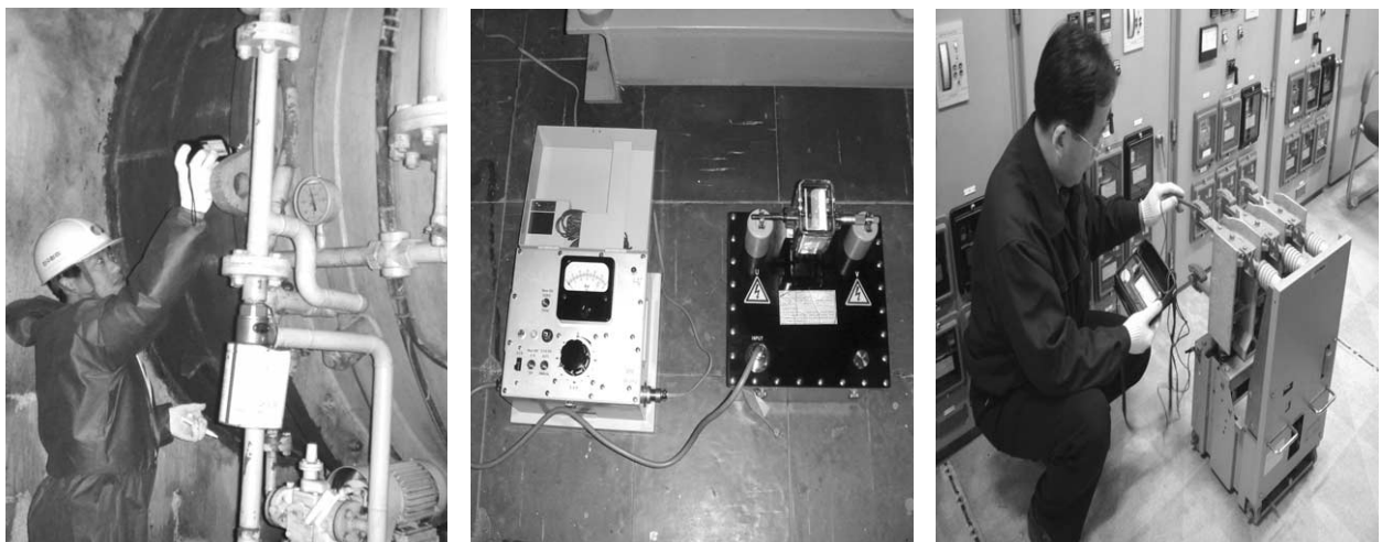
[그림 5] 민영 소수력 A/S 기술지원 점검

향후에도 민간 소수력 사업자 만족도 및 소수력 운영 상태 개선을 통한 신재생에너지 이용 극대화 차원에서 민영 소수력발전소에 대해 정기적으로 점검을 시행할 예정이다.