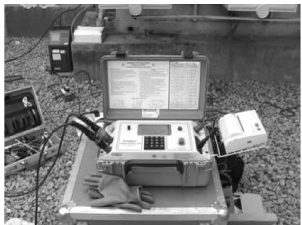
[그림 4] 절연진단 시험장비