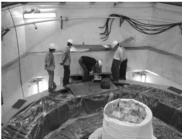
[그림 3] 절연진단 시험