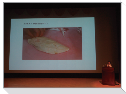
오리고기 손질하기 동영상

이번 강연은 5월 2일 신촌에서 열린 오리데이 페스티벌 행사에 앞서 진행돼, 오리고기 리플렛을 배포하며 행사안내를 자세히 하는 한편 우리 회원사인 (주)정다운(대표 이영)은 이날 강연 참석자들에게 훈제오리1kg을 협찬하였다.