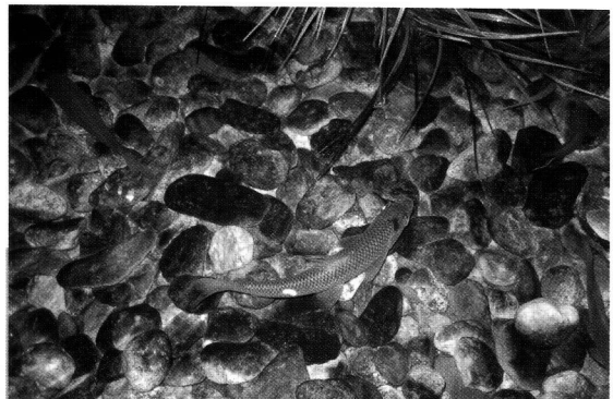
〈그림 2〉곡우 때가 되면 누치는 본능적으로 수심이 깊은 강의 중류 수역에서 얕은 개울로 올라와 짝짓기를 한다.