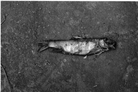
〈그림 3〉누치 없이 낚싯밥을 잘못 물었다가 미라가 되어 강변에서 말라가는 누치. 살아남은 누치 무리를 위해서 불량 낚시꾼을 구분하는 누치코치라도 해주어야 할 듯.