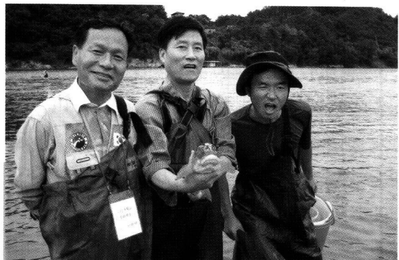
〈그림 4〉남한강 생태조사에서 채집한 누치를 들고 기념 촬영한 필자와 연구원 일동. 한 연구원이 누치의 인상을 재연하려고 오만상을 구기며 쪽부림을 하고 있다.