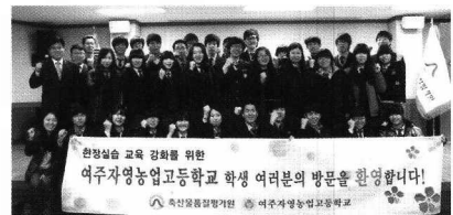
교육을 마치고 ...

학생들의 현장 실습 교육 강화를 위하여 지난 4월3일(화)부터 10일까지