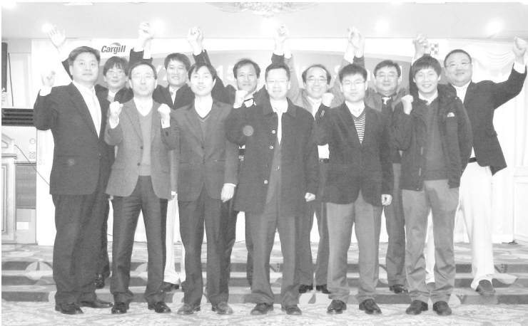
▲ 사료업계에서는 처음으로 양계사업본부를 운영하고 있는 카길애그리퓨리나 멤버들이 의지를 다지고 있다.