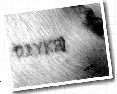
[돼지고기 이력제 시범사업 추진체계]

한편, 돼지고기 이력제는 2013년 초에 30개소로 참여 업체를 확대하여 2013년 말 전국적으로 전면 실시할 예정이다. 등재