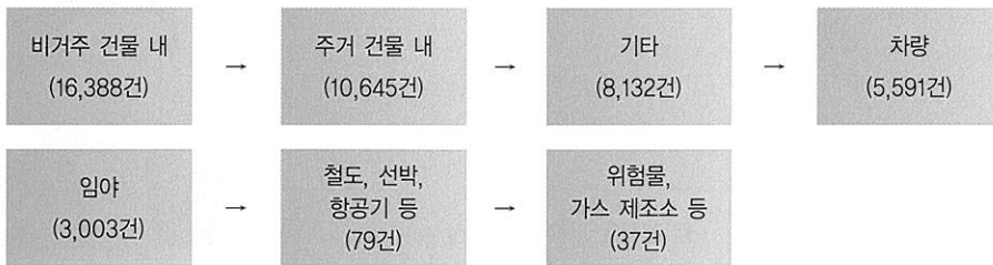
[도표 1] 화재발생 장소별 건수

[도표 1]과 같은 통계자료를 통해 볼 때, 화재가 가장 많이 발생하는 장소가 비거주 건물, 즉 상가, 공장, 공연장 등으로 사고가 발생하면 피해규모가 클 수 있는 장소에서 다발하고 있음을 알 수 있다.