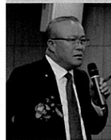
새누리당 김희국 의원

최저가낙찰제는 건설업체 간 과당경쟁과 저가수주를 유발시켜 건설공사 이행과정에서 무리한 공기 단축과 노무비 절감을 초래합니다. 이는 결국 건설현장의 산업재해 증가의 원인이 되고 있습니다. 때문에 공사금액을 기준으로 획일적으로 적용하는 최저가낙찰제를 공사입찰 방식에서 배제하고, 공사의 유형과 계약의 성질 등을 고려한 입찰방식이 필요합니다.