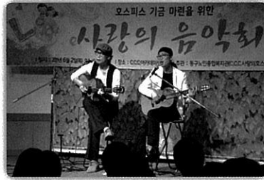
사랑의 음악회 (후원활동)