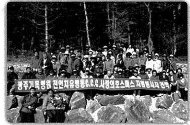
호스피스 자원봉사자 야유회