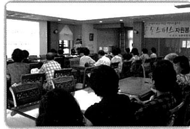
호스피스 자원봉사자 보수교육