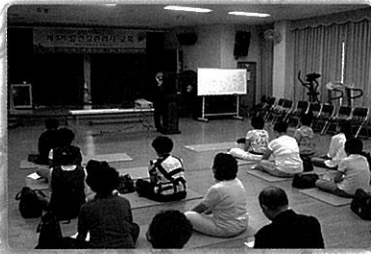
발건강 관리자 교육