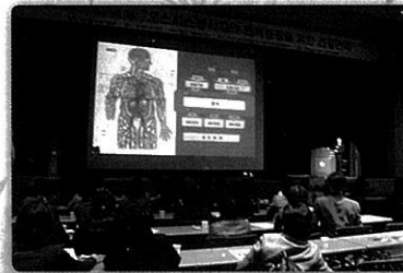
광주전남 호스피스 자원봉사자 대회