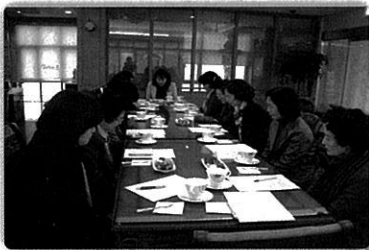
호스피스 자원봉사자 팀장모임