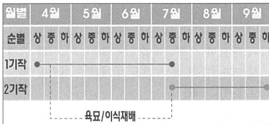
▼ 그림1 참깨 일반작형(1년 1작)과 2기작(1년 2작) 재배체계도

일반적으로 참깨는 5월에 파종하여 9월에 수확하지만, 새로 개발된 2기작 재배법은 4월부터 7월까지 첫 번째 수확하고 7월부터 9월까지 두 번째 수확을 함으로써 전체적으로 1년에 2회 참깨재배를 통하여 수량성과 농가소득 증대효과를 가져온다(그림1). 참깨 2기작 재배는 최근 이상기상 등 기후변화 대응 차원에서 경지 이용률을 높이고 소득을 창출할 수 있는 기술로서 여기에는 극 조생종 품종이 필요하고, 옮겨심기 기술이 결부되어야만 소득창출효과를 낼 수가 있다. 또한 기상조건이 정상적인 환경으로 설정되어야만 소기의 성과를 달성할 수 있다.