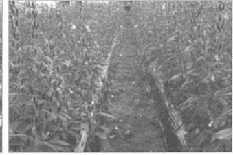
▲ 참깨 생육모습 : 성숙기