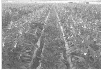
▲ 참깨 생육모습 : 개화기