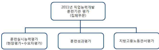
그림 3. 집체훈련부문 훈련기관 평가영역 Fig. 3. Evaluation domain for training organization of collective training program

직업능력개발 훈련기관 평가 중 집체훈련부문(내일배움카드제, 국가기간전략산업직종, 재직자위탁훈련)의 평가영역은 다음과 같다[6].