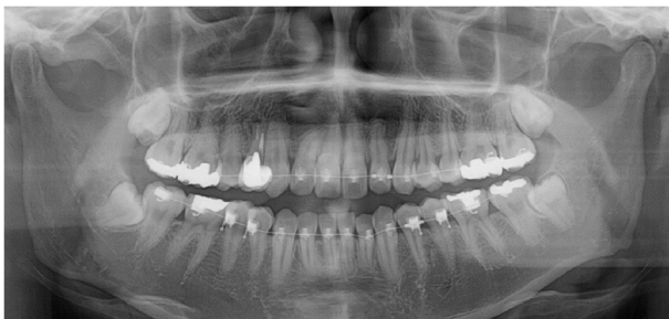
Fig. 1. Panoramic radiograph

안기능 검사상 안구운동은 정상이었으나 시력(visual acuity)의 저하를 호소하였다. 안면근육 검사를 통한 안면신경 평가 역시 정상이었다. 동측 안면부위의 작열감이나 떨리는