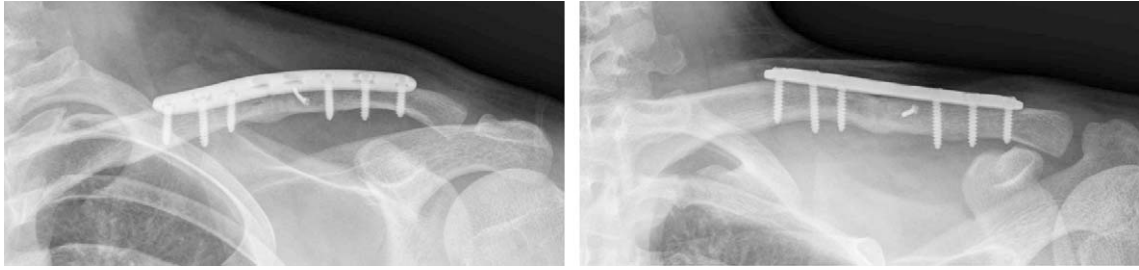
Fig. 3. The radiograph 4 month after operation shows complete union.