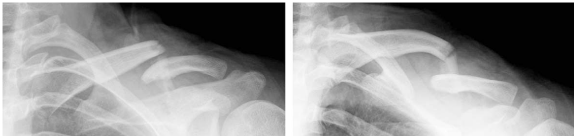
Fig. 2. The preoperative radiograph of a 31 year old male shows displaced and angulated clavicular fracture after a traffic accident.