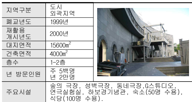
표2. 밀양연극촌 시설개요

※ 출처: 연희단거리패 홈페이지, http://www.stt1986.com