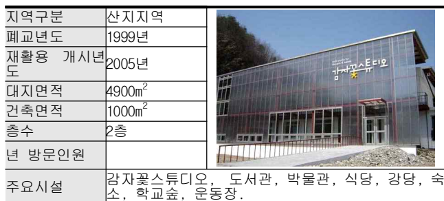
표4. 감자꽃스튜디오 시설개요

※ 출처: 감자꽃스튜디오 홈페이지, http://www.potatoflower.org