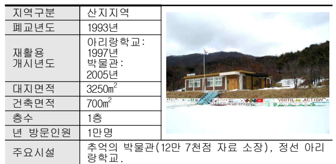
표3. 정선 아리랑학교와 추억의 박물관 시설개요

※ 출처: 정선 아리랑학교 홈페이지, http://www.ararian.com