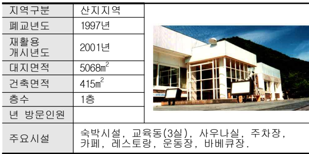
표5. 수하산 알파인러지엔클럽 시설개요