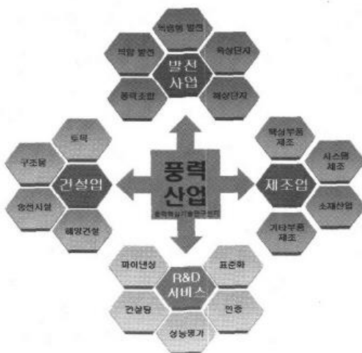
그림 2. 풍력산업의 구조

풍력산업의 가장 대표적인 산업은 풍력발전기 제조업과 풍력발전단지 산업이다.