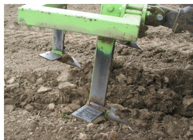
(b) Subsoiling blade