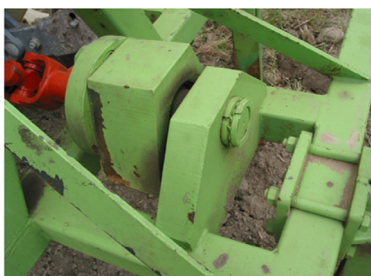
(a) Spindle for vibration

옥수수 품종은 광평옥이었는데, 파종기는 2010년은 5월 12일, 2011년은 5월 18일이었다. 옥수수의 재식밀도 66,667 주 ha -1 (재식거리 75×20 cm)로 2립씩 파종하여 3~4엽기에