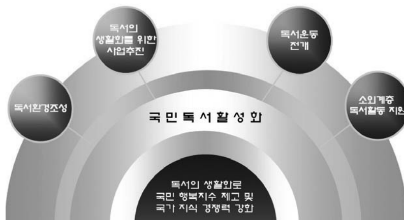
<그림 2> 독서문화진흥 기본계획의 기본방향과 비전(문화체육관광부 2011)

기본 5개년 계획에서 제시하는 바와 같이 각종행사, 매체를 활용한 독서운동을 대상으로 한다.