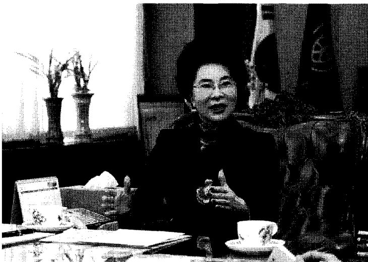
[이길여 | 가천대학교 총장]

교육과학기술부의 일관된 대학구조개혁 정책에 부응해 학령인구 감소 등 미래 환경 변화를 예측하고 대학 경쟁력 강화를 위해 단계