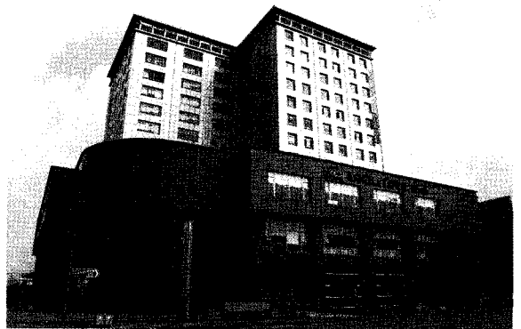
▲ 중국상해 영업법인

이러한 노력의 결과 2006년 8월에는 중국 시장 진출 2년 만에 ‘제4회 중국시장 소비자 만족 브랜드 조사’ 가정용품-식품 신선도 유지 제품 부문에서 (주)락앤락이 해외 유명 기업들을 제치고 1위를 차지