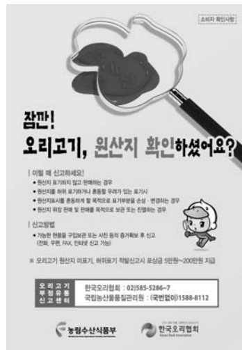
▲ 오리고기 원산지 확인 '소비자 확인사항'

전단지는 양면으로, 한 면에는 판매자 준수사항이, 다른 한 면에는 소비자 확인사항이 게재되어 있다.