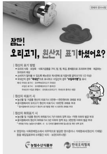
▲ 오리고기 원산지 표기 '판매자 준수사항'

우리 협회는 지난해 8월 11일부터 실시하고 있는 '오리고기 원산지 표시제'를 적극 알리고자 오리고기 원산지 표기 전단지를 제작·배포하였다. 지난 연말 발생한 AI로 오리고기 수급상황이 악화됨에 중국산 훈제오리고기와 대만산 냉동오리의 수입량이 증가하였고, 값싼 수입 오리고기를 재포장하여 국내산으로 둔갑 하는 사례와 원산지미표시 등 부정유통이 늘어나고 있다. 이에 협회는 오리고기 부정유통 신고센터를 운영하고 있으며, 소비자들과 판매자들이 오리고기 원산지표기에 관해 알기 쉽도록 전단지를 제작하였다.