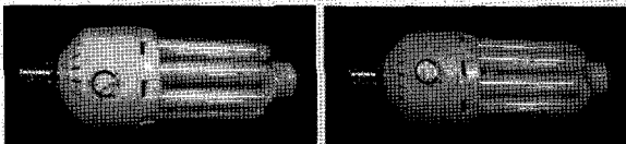
[사진 4] 인체감지센서와 광센서를 탑재한 '센서형광램프'