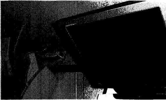
【사진 5】 대기전력차단용 인공지능형 “하이세이버” 설치상태

가전기나 전기·전자기들은 사용하지 않는 상태에서 단지 전원콘센트에 플러그가 꼽혀만 있어도 소모되는 전력으로, 가정 소비전력의 11% 이상을 점유하여 에너지 절감방안의 하나로 크게 대두되고 있으며, 또한 네트워크 상에서 연결된 디지털기기는 전원을 꺼도(소비자는 꺼진 것으로 착각) 외부로부터 신호를 기다리기 위해 실제로는 내부 회로가 살아있는 상태에서 20~30W에 이르는 많은 대기전력을 소비하고 있다. 컴퓨터관련기기에 인공지능 자동절전 멀티콘센트인 “하이세이버”를 설치하면 평상시 대기전력이 1/2로 줄어들고 사용하지 않을 때 플러그를 뽑은 절전효과가 있다.