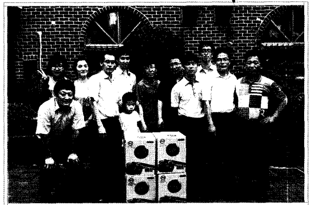
영아원 아이들과 정(情)을 나누다