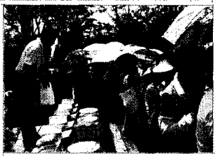
축산물 소비촉진을 위한 홍보 행사 개최