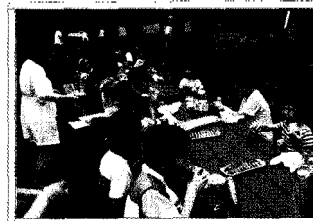
아이들과 '함께' 하는 즐거운 하루