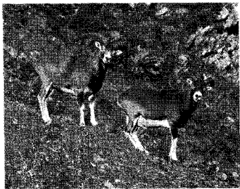
<가축양의 조상으로 알려져 있는 야생의 무프룬>

가축화된 양의 염색체수가 2n=54 개 이므로 이중 무프룬(Mouflon)이 가축양의 조상으로 알려져 있다. 무프룬은 서식지역과 외모로 아시아형과 유럽형으로 분류되는데 이중 아시아 무프룬이 가축화 되었다는 것이 유력한 설명이다. 특히 중앙아시아에 서식하고 있는 우리알(Urial) 종도 외모적으로는 무프룬과 유사하고 서식지 또한 혼재되어 있어 가축화된 양의 야생근연종으로 알려져 왔지만 최근의 DNA 및 염색체의 연구로 현존하는 가축양에 유전적인 영향을 주지 않았다는 것이 확인되었다.