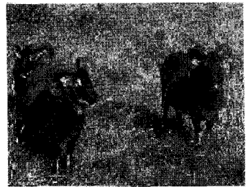
<가축화된 면양중 가장 작은 품종인 소이종, 성숙한 수컷이 25kg정도>