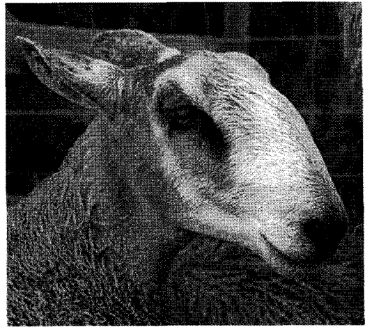
<가축화로 하악골이 짧아졌으나 상악골은 변화하지 않아 비경이 함몰되어 있는 경우가 있다. 이런 것을 토끼머리, 로마인의 코라고 표현하기도 한다>

분리되었다. 양이 먹이를 먹을 때는 이것을 잘 이용하여 지면에서 퍼져있는 짧은 풀이나 줄기 등을 잘 먹을 수 있다.