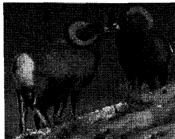
<북미대륙에 서식하는 빅혼종, 가축화된 양의 조상은 아니지만 가축양과 교배가 가능함>