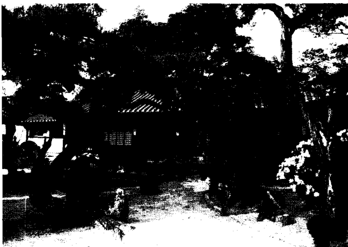
〈사진 2〉 건재고택 대문앞에서 바라본 사랑채와 정원 모습