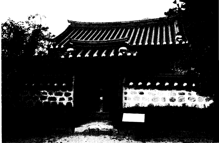
〈사진 4〉 종손댁 옆에 자리잡은 외암사당

다음으로 참판댁과 참봉댁, 그리고 송화댁 등이 있는데, 참판댁은 이조 참판을 지낸 퇴호 이정렬 선생이 살던 집이라 '참판댁'이라 불리며, 참봉댁은 다른 집과 달리 특이하게 'ㄷ'자형 안채와 사랑채가 나란히 2열로 평행 배치된 구조를 갖고 있다고 한다. 그리고 송화댁은 과거 송화군수를 지낸 이장현으로 인해 태호가 붙여졌는데, 이 고택은 앞쪽의 사