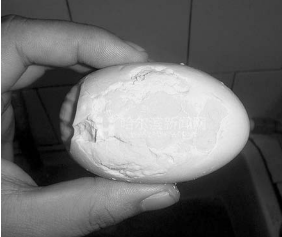
중국 하얼빈시에서 고무로 만든 '가짜 오리알'의 유통

사실이 적발됐다고 중국 동북망이 10월 23일 보도했다. 보도에서 한 주부는 지난 10월 19일 하얼빈 시장에서 1위안짜리 오리알 20개를 구입해 삶았는데 고무 타는 냄새와 함께 진흙물이 됐다고 전했다. 이를 수상하게 여긴 주부는 오리알을 탁자에 던졌고 오리알이 고무공 처럼 튀어 올랐다고 설명했다.