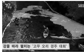
강을 따라 펼쳐지는 '고무 오리 경주 대회'