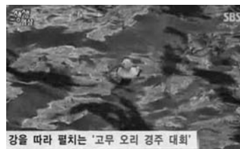
강을 따라 펼쳐지는 '고무 오리 경주 대회'

지난 10월 16일(현지시간), 미국 로드아일랜드주 컴벌랜드에서 올해로 세 번째를 맞이하는 '고무 오리 경주 대회'가 수천 개의 노란색 고무 오리들과 함께 열렸다. 참가자들이 미리 구입한 고무 재질의 아기 오리 수천 개가 강으로 쏟아지고, 열렬한 응원과 함께 레이스가 시작됐다. 이 경기에 출전한 오리 인형들은 개당 5달러, 우리 돈 6천 원 정도에 판매되는데, 수천 마리나 되다 보니 수익금도 적지 않다. 이렇게 모인 수익금 일부는 자선 목적으로 기부될 예정이다.