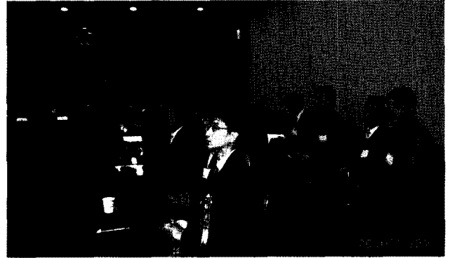
〈2010년 4차 이사회 전경〉